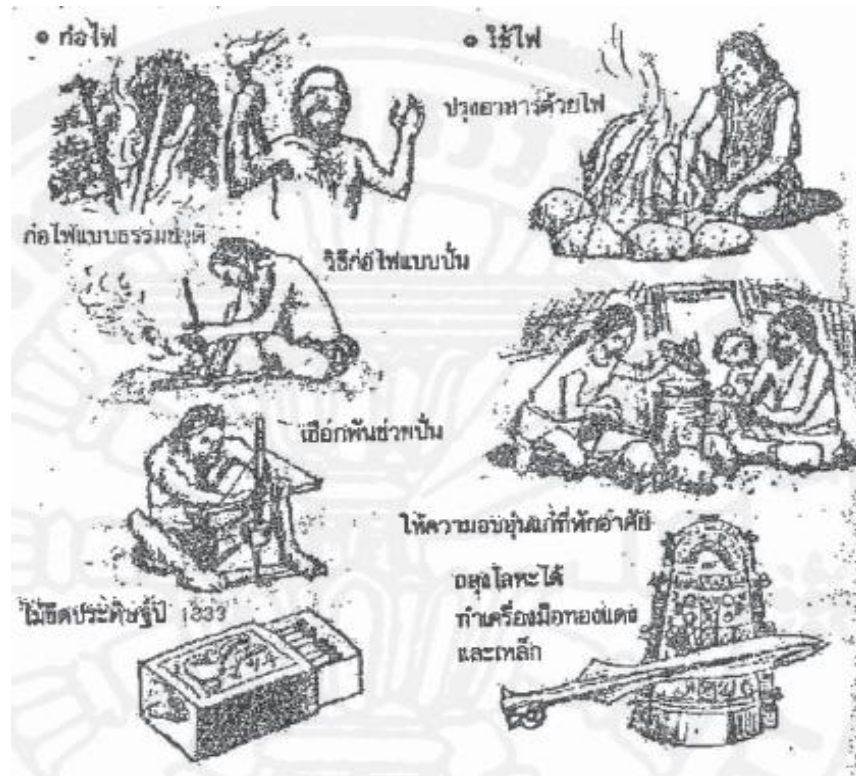
ภาพที่ 2.2 การปรับปรุงเครื่องมือการดำเนินชีวิตในอดีต. จาก เพลดเพลินเป็น 100 เท่า กับการเสนอแนะเพื่อการปรับปรุง: วิธีดำเนินกิจกรรมการปรับปรุงและวิธีเพิ่มพลังความคิด สร้างสรรค์ (น. 60), โดย วีรพจน์ ลือประสิทธิ์สกุล, 2544, กรุงเทพฯ: ธรรมมลการพิมพ์.